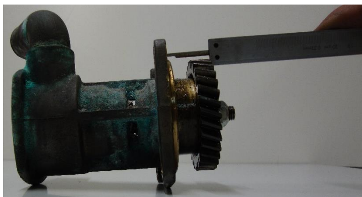
Mesure hauteur pignon / engrenage